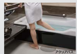
またぎの高さが356mmと低く設計された浴槽

在来浴室の場台深さ60cmの浴槽が多く、埋込み式にすることでまたぎの高さは抑えられても、洗い場床面と浴槽底面の段差が開き、身体の軸が傾いてバランスを崩し易くなります。現在ではニバーサルデザインの面からも、メーカー各社で工夫された「またぎ易い浴槽がラインナップされています。