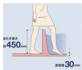
洗い場床と浴槽底面の高低差を低減し、浴槽の出入りのしやすさに配慮

在来浴室の場台深さ60cmの浴槽が多く、埋込み式にすることでまたぎの高さは抑えられても、洗い場床面と浴槽底面の段差が開き、身体の軸が傾いてバランスを崩し易くなります。現在ではニバーサルデザインの面からも、メーカー各社で工夫された「またぎ易い浴槽がラインナップされています。